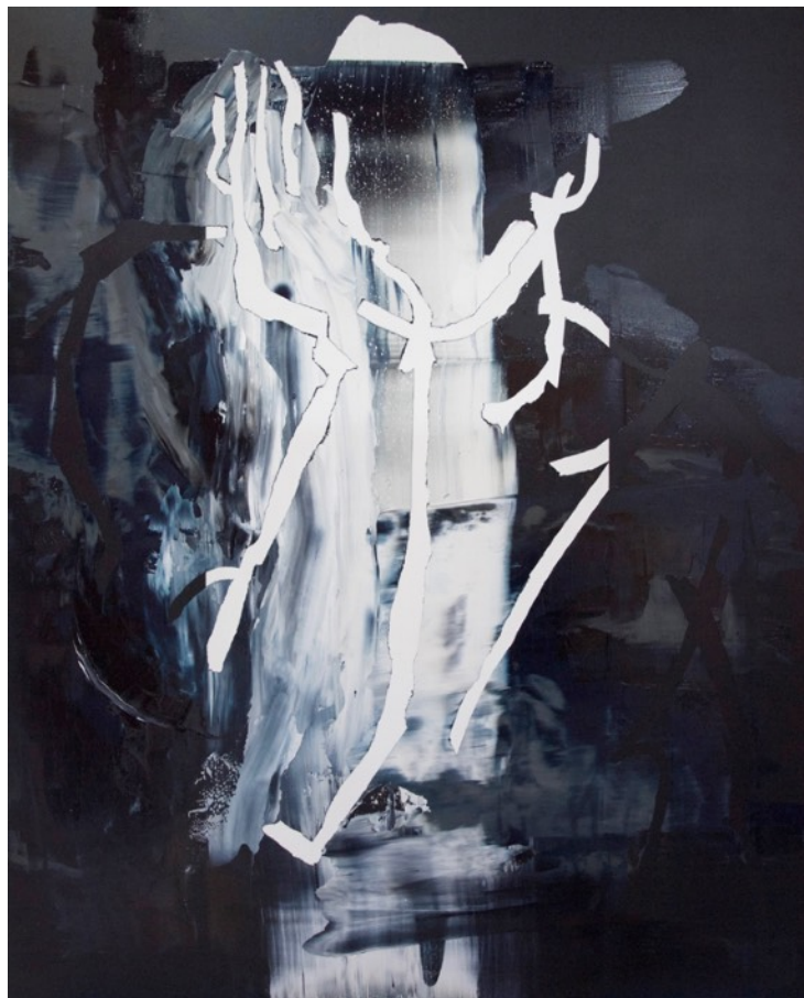
It was impossible to guess whether it meant 'yes' or 'no', 2018 acrylic and oil on canvas panel, 910 x 727 mm