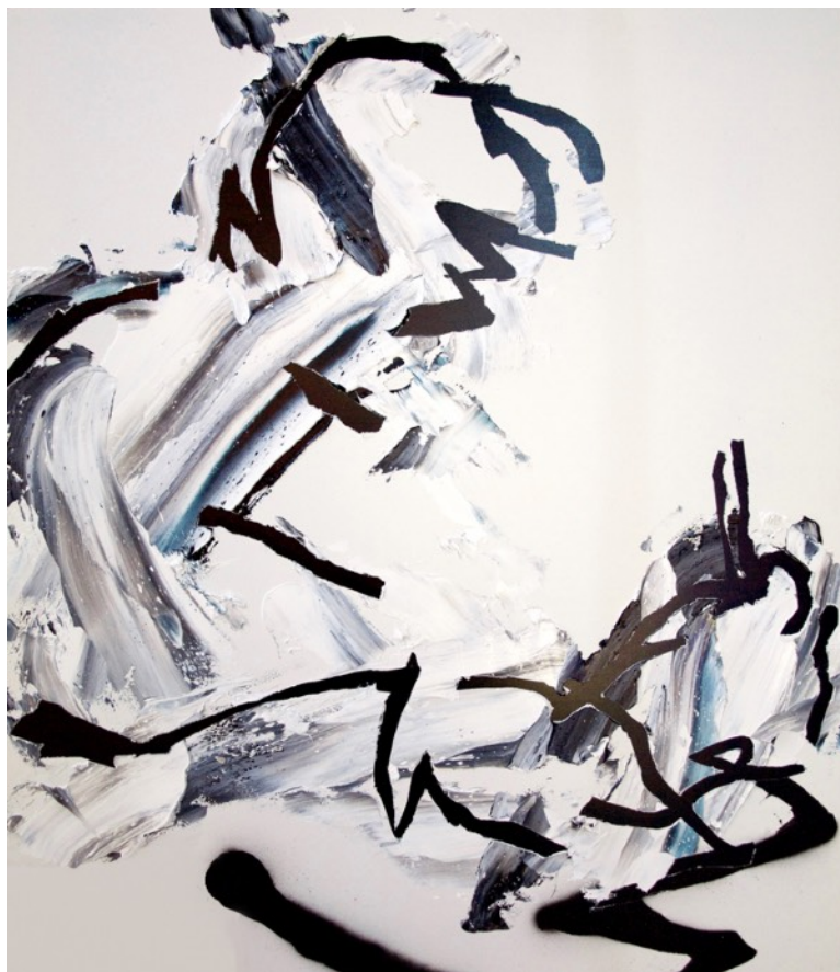
His drawing drawing, 2017, acrylic and oil on canvas panel, 530 x 455 mm