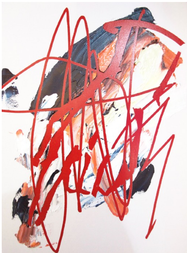
Pointing finger, 2017, acrylic and oil on canvas panel, 333 x 242 mm

現代における「平面」とは、もはや触れることのできる紙やキャンバスや壁面にとどまらず、モニターやスマートフォンやタブレットなどのディスプレイと、その中に映し出される世界にも及ぶと考えられるでしょう。「無数の平面（ディスプレイ）に囲まれながら、時に私たちは目の前の現実と平面世界を混同し、その浅い空間での現象がまるで体験した出来事のように、または日常で会うものや人がふと薄っぺらく感じるように、私たちの認識は平面と物体との間で揺れ動いています。」と久保が言うように、私たちのモノや世界の知覚方法が変化してきた中で、果たして絵画を通して何が知覚されるのか、それを探る行為として新たな平面世界を構築する久保紗也の新作群に、是非ご期待ください。