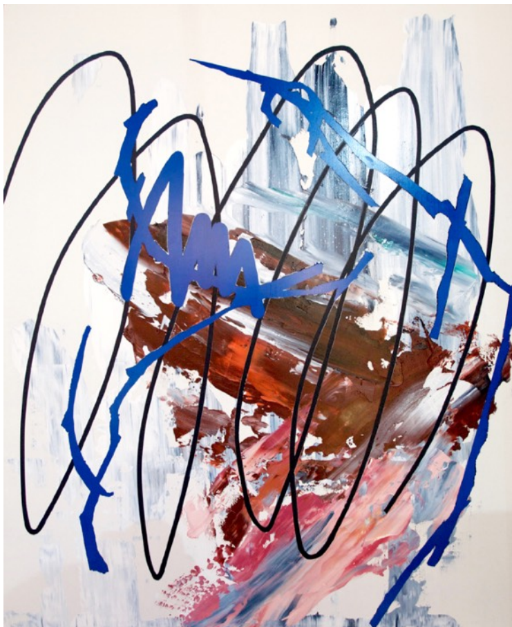
She's Dropping, 2017, acrylic and oil on canvas panel, 803 x 652 mm